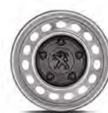
RINES DE ACERO DE 16"