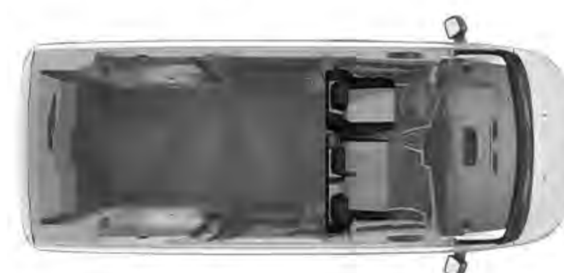
FURGÓN 6.1 m 3 1,400 kg

SI NO ESTÁS SATISFECHO CON EL SERVICIO POST VENTA, NO LO PAGAS.