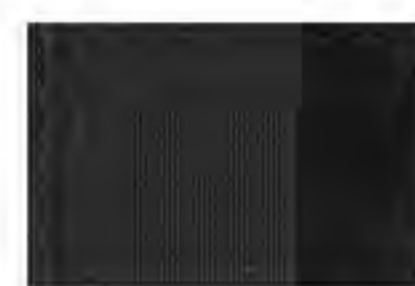
FURGÓN ASIENTOS EN TELA