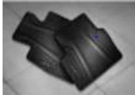
TAPETES TODOD CLIMA $3,550