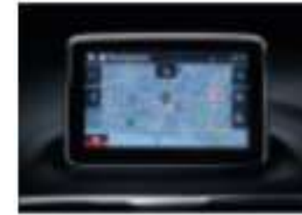
SISTEMA DE NAVEGACION $11,900