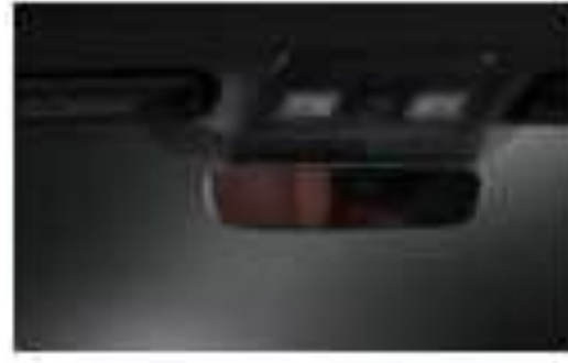
ESPEJO CON INSTALACION $8,000