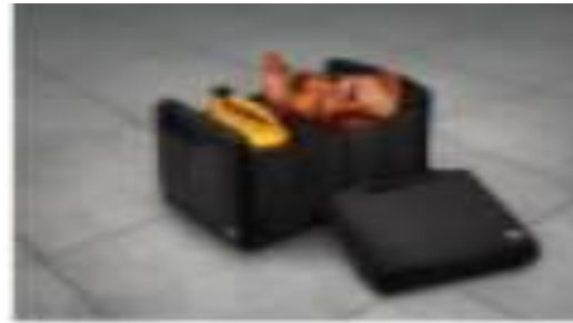
ORGANIZADOR DE CAJUELA $1,900