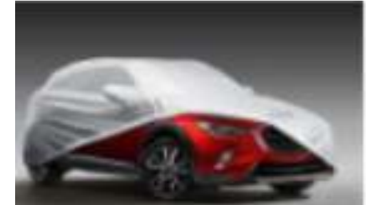
CUBIERTA TODO CLIMA $5,400