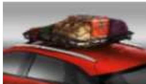
CANASTILLA CON RED $9,200