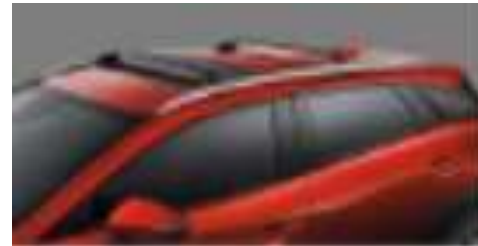
DEFLECTOR DE QUEMACOCOS $2,900