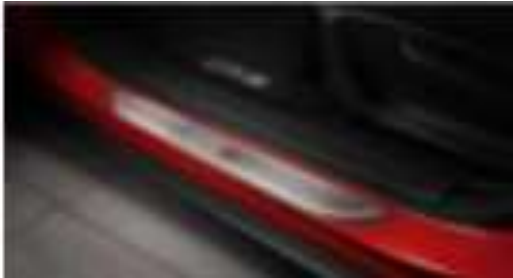
Placa umbral con luz $ 4,500