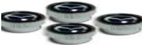
VALVULAS DE NEUMATICOS $400