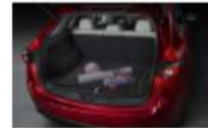
RED DE CARGA $1,450