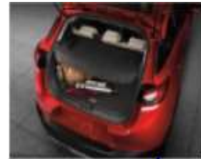
CUBIERTA DE CARGA $3,500