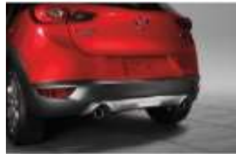
PARACHOQUES TRASERO $7,950