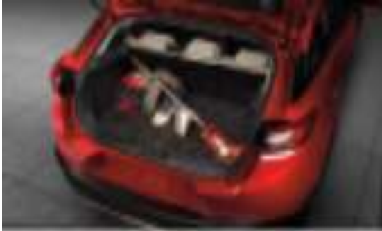
BANDEJA DE CARGA $ 2,500