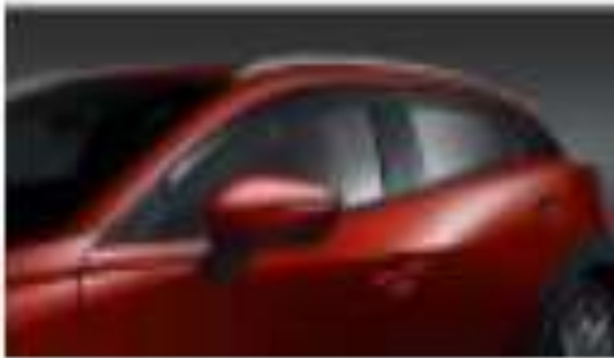
DEFELECTOR DE VENTANILLAS $3,500