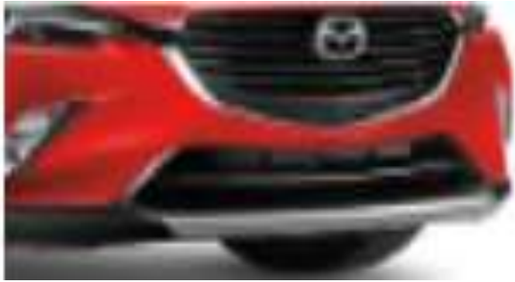
PARACHOQUES DELANTERO $7,950