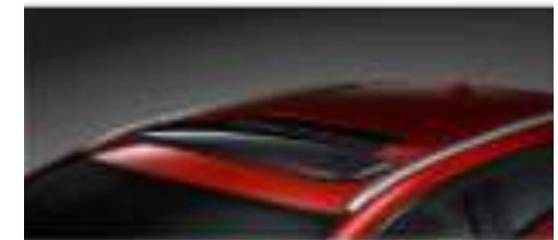
BARRAS CRUZADAS $4,500 BARRAS LATERALES $ 7,500