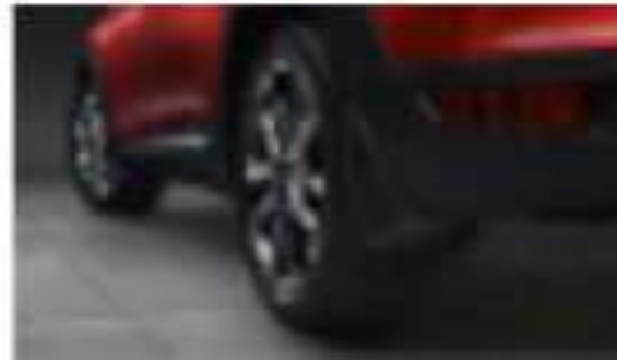
JUEGO DE LODERAS 4 PIEZAS $5,000