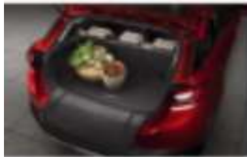
BUQUE DE CARGA $2,950