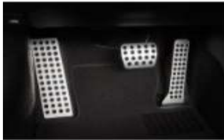
PEDALES $ 8,000