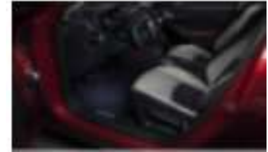
KIT DE ILUMINACION INTERIOR $6,400