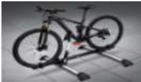
PORTABICICLETAS $ 5,800