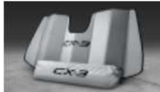
PROTECTOR SOLAR $1,700